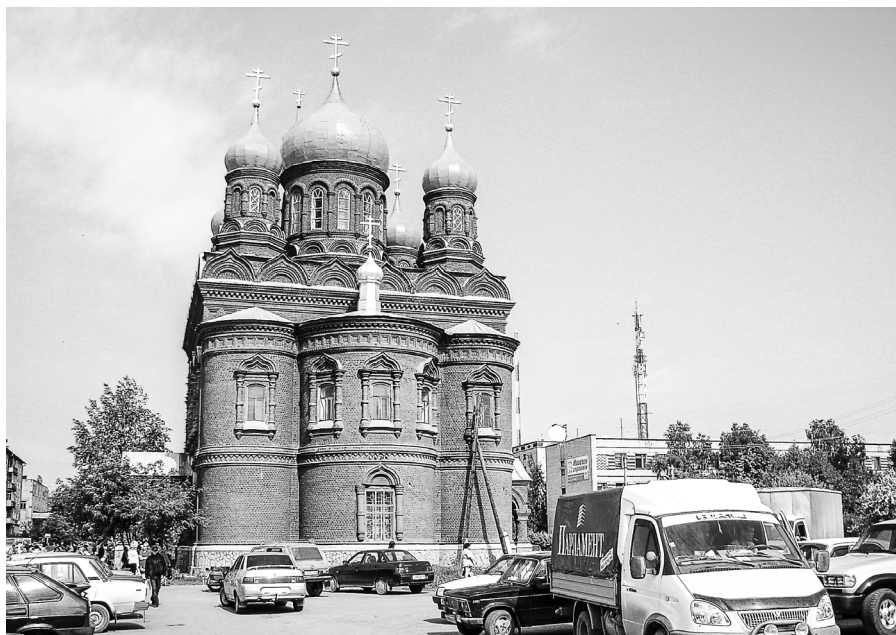
Церковь во имя Александра Невского.