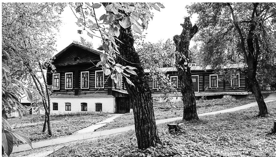
Один из павильонов земской уездной больницы на Девьей горе

Лицом города и его гордостью можно считать здание железнодорожного вокзала. Построено оно в 1915 году по проекту выдающегося русского архитектора, академика, четырежды лауреата Государственной премии Алексея Викторовича Щусева (1873–1949).