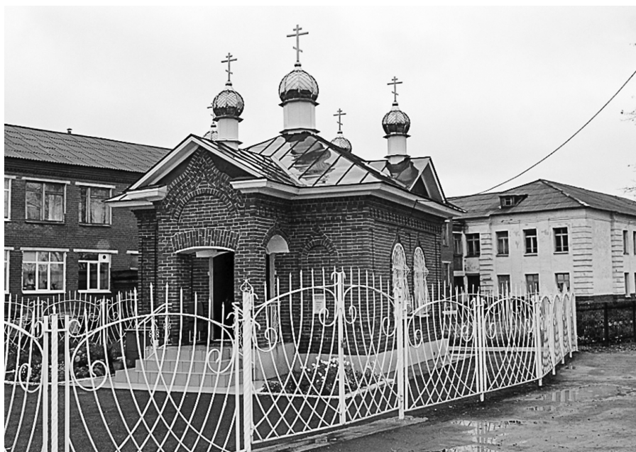
Часовня Ильи Пророка, ул. Р. Горбуновой, 13