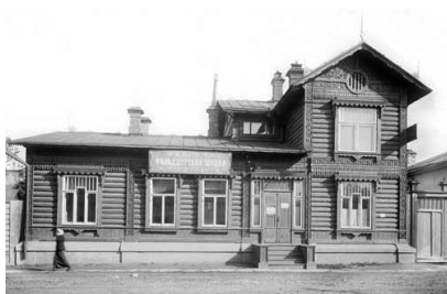
Рис. 2. Здание фельдшерской школы Р. Н. Кленовой в Екатеринбурге, ул. Пролетарская (бывш. Офицерская), 8

Преподавание теоретических и практических предметов проводилось по планам и программам, утвержденным министерством внутренних дел в 1903 г. Педагогический совет школы критически рассмотрел эти планы и программы и внес существенные изменения. Было увеличено число часов на практические занятия и расширены программы основных предметов. В общем, преподавание строилось на основе широкого использования практических занятий по всем клиническим дисциплинам. Часы по предметам распределялись следующим образом (см. таблицу).