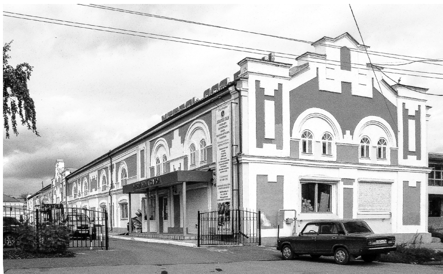
Большой гостинный ряд, ул. Куйбышева, 3

* На карте 1790 года гора названа Девичьей. В «Журналах Красноуфимского уездного земского собрания» также указывается Девичья гора. Об изменении названия «Девичья гора» на «Дивью гору» документов не имеется; тем не менее в изданиях советского времени гору называют Дивья. Вопрос, почему в слове произошла замена «е» на «и», на сегодня остается без ответа.