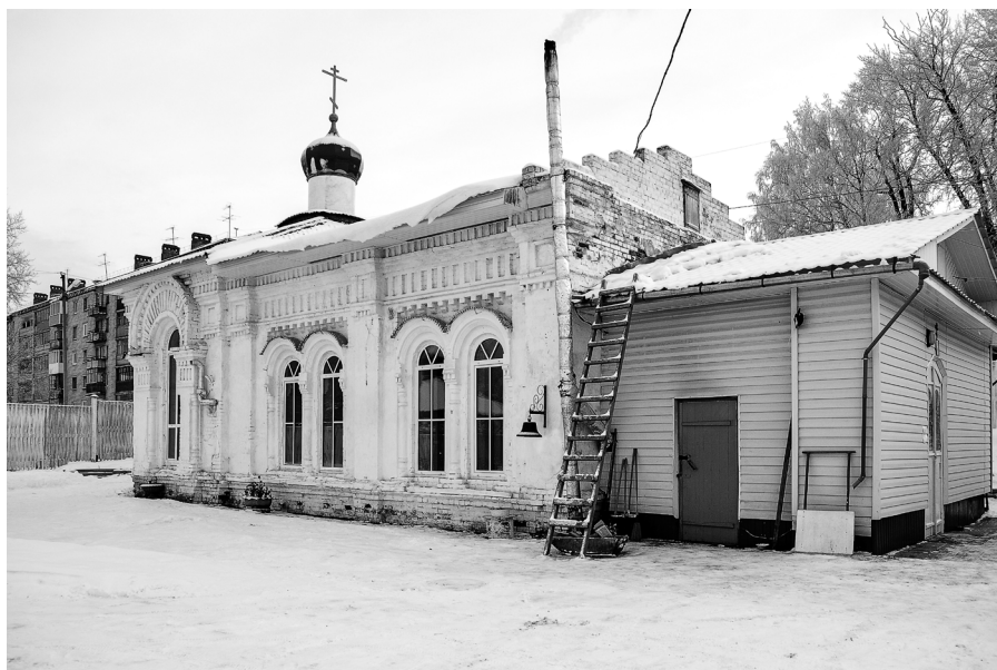
Церковь во имя Покрова Святой Богородицы, ул. Селекционная, 15