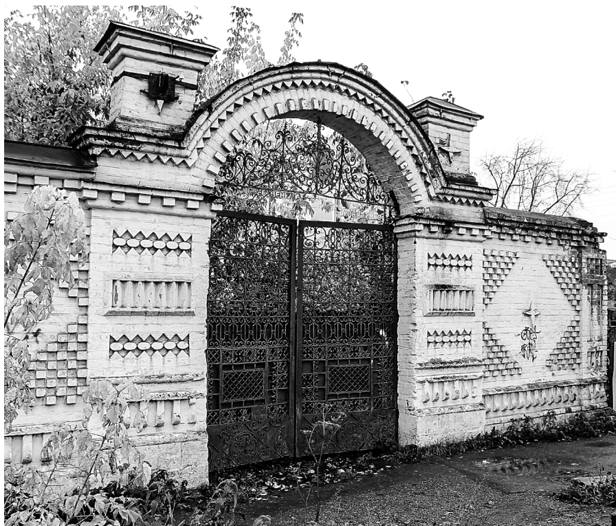
Ворота с ажурной ковкой, ул. Интернациональная, 95

и ажюра [5, стр. 31]». До 1870 года единственным высоким сооружением в городе был Собор во имя Святой Троицы, после начинают появляться и другие крупные объекты.